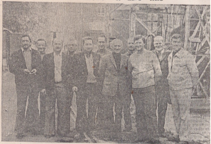
Le « dernier carré »

Cent cinquante-six ouvriers, cadres, employés recurent leur avis de licenciement, et les derniers d'entre eux à quitter les lieux se rassemblèrent, mercredi, pour souligner la cessation définitive d'activité. La dernière visite des lieux, les commentaires parfois acerbes étaient accompagnés de remarques faites sur un ton qui se voulait gouaillieur mais qui ne trompait personne : chacun avait le cœur gros et personne ne se décidait à quitter des lieux que certains avaient fréquenté quel-